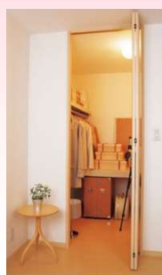
ウォークイン クローゼット