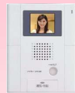
テレビインターホン