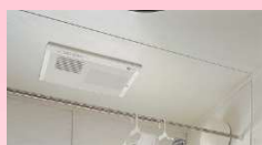
暖房付き 浴室換気乾燥機

☆たっぷり収納「ウォークインクローゼット」 ☆広々くつろげる「フローリング8帖」 ☆快適な「冷暖房完備」