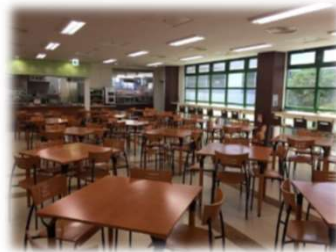
職員のみが利用できる「職員食堂」