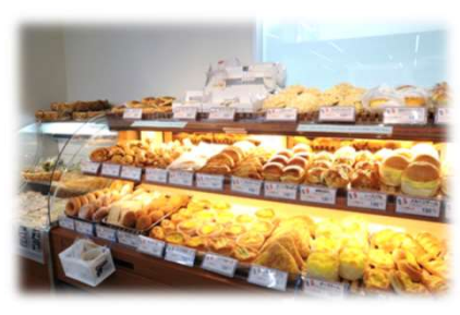
～焼きたてパンも販売中～