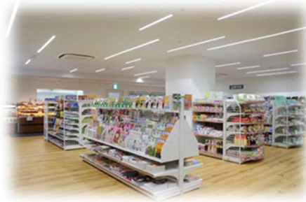
～コンビニ機能も充実～