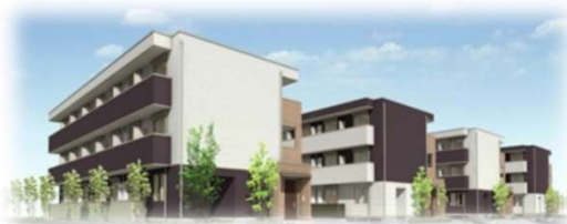
職員寮 敷地内 通勤時間1分！