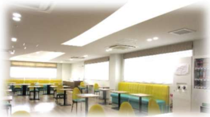
ラウンジ(職員休憩所)