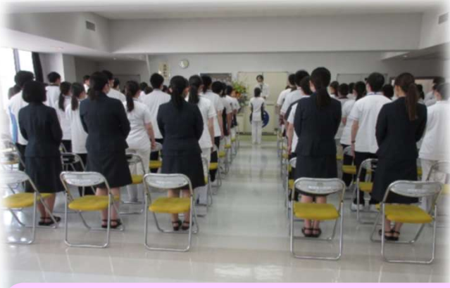
入職式の写真です 今年度は70名の新入職員が入職しました 多職種でたくさんの同期ができます