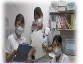
医師・看護師など他職種との距離も近いです