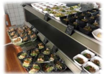
職員のみが利用できる「職員食堂」