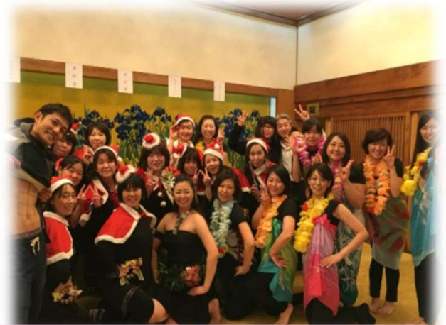
職員が牛久かっぱ祭りと忘年会に参加したときの写真です※参加は任意です

医療法人社団 常仁会 牛久愛和総合病院 〒300-1296 茨城県牛久市猪子町896番地