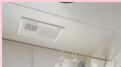
暖房付き 浴室換気乾燥機