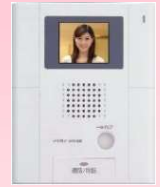
テレビインターホン