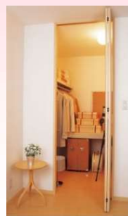
ウォークイン クローゼット