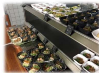
職員のみが利用できる「職員食堂」