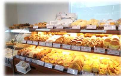
～焼きたてパンも販売中～