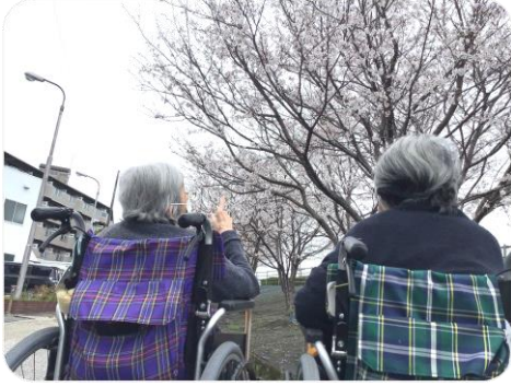
周辺の桜が今年もきれいに咲きました