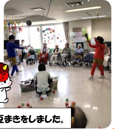
病気や邪気を鬼に見立てて、節分の豆まきをしました。