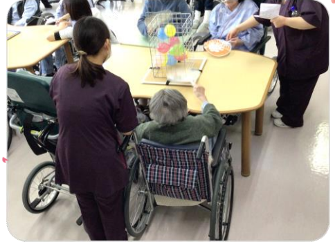
風をおこして風船を出そう！